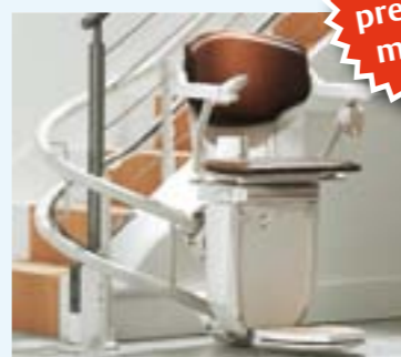
Einige Einbaubeispiele mit einer kleinen Auswahl aus unserer Modellvielfalt